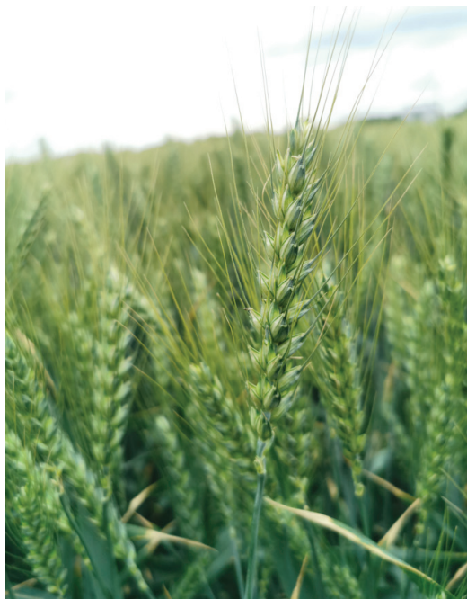
A Complice termései az elmúlt 4 évben

IKR Agrár kísérletek: 6,7,7,5 kísérlet átlaga